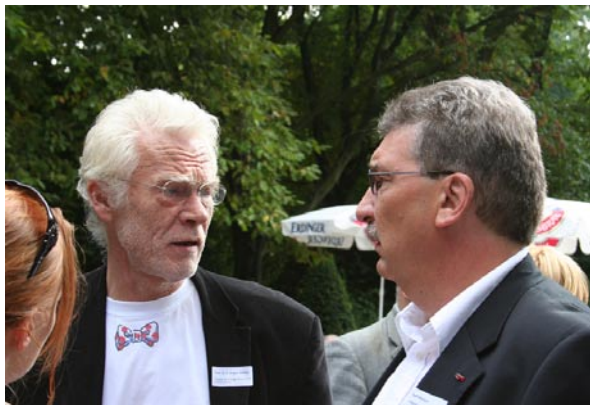
Bildungssenator Zöllner (links) im Gespräch mit dem Abgeordneten und Vorsitzenden des Hauptausschusses Ralf Wieland während des Sommerbrunch der SPD Mitte Anfang September.

Längeres gemeinsames Lernen, eine größere Durchlässigkeit des Schulsystems, mehr praxisorientiertes Lernen – das sind Ziele von Bildungssenator Jürgen Zöllner. Auf dem Weg dahin sollen auch die Schulstrukturen verändert werden. Noch in dieser Legislaturperiode könnten, so Zöllners Vorschlag, Haupt- und Realschulen zu „Integrierten Haupt- und Realschulen“ zusammengefasst werden. In einem zweiten Schritt würden sie zu „Regionalschulen“ weiterentwickelt.