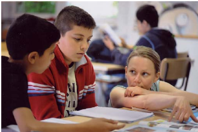
Sprache ist die Grundvoraussetzung für Lernen in der Schule. 200 Jugendliche holen bei „Sprint“ ihre Rückstände auf.

Diese Jugendlichen können sich zwar mündlich in Alltagsdingen recht gut ausdrücken, sobald es aber zum Lesen schwieriger Texte kommt oder - schlimmer noch - eigene Texte geschrieben werden müssen, offenbart sich die ganze Sprachschwäche. Aber Lesen und Schreiben sind eben Grundfunktionen des schulischen Lernens.