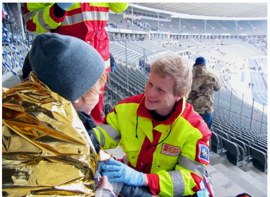
Ob als Betreuungsdienst bei Veranstaltungen oder im Sanitätsdienst wie z.B. hier im Berliner Olympiastadion - die Tätigkeitsfelder des ASB sind vielfältig.